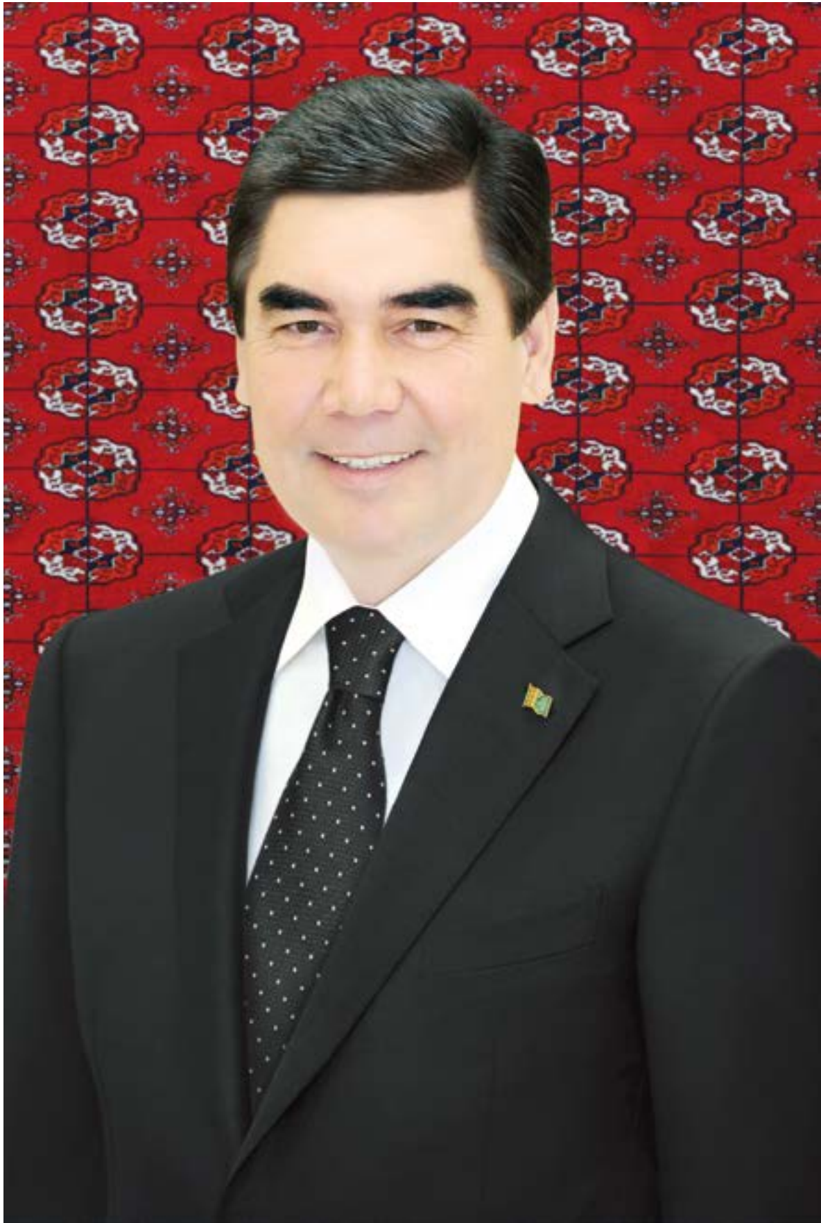
TÜRKMENISTANYŇ PREZIDENTI GURBANGULY BERDIMUHAMEDOW