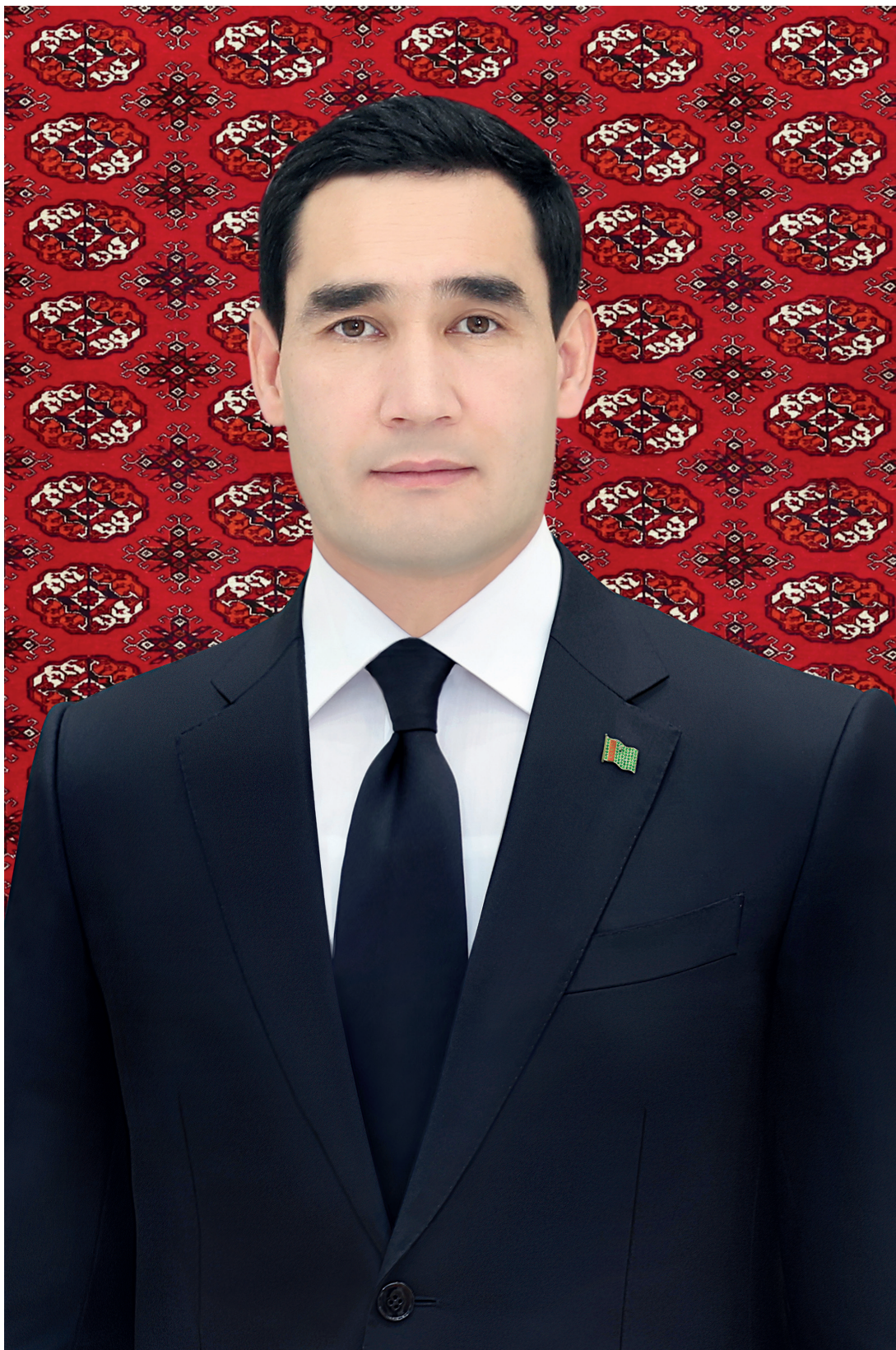
TÜRKMENISTANYŇ PREZIDENTI SERDAR BERDIMUHAMEDOW