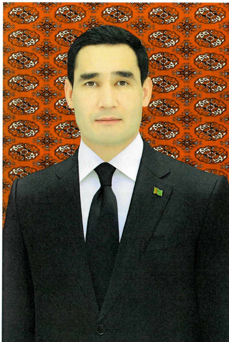
TÜRKMENISTANYŇ PREZIDENTI SERDAR BERDIMUHAMEDOW