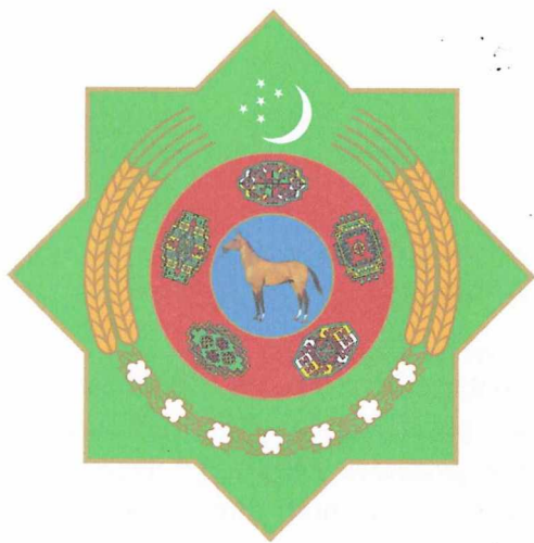
TÜRKMENISTANYŇ DÖWLET TUGRASY