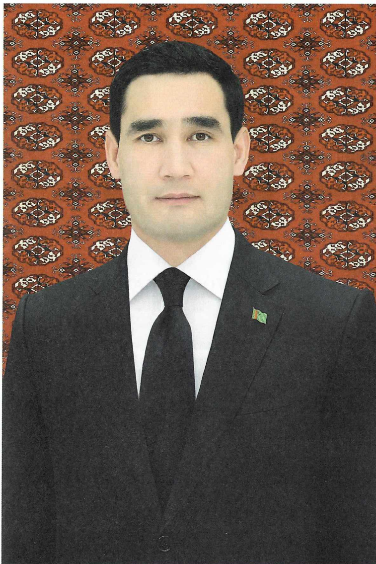
TÜRKMENISTANYŇ PREZIDENTI SERDAR BERDIMUHAMEDOW