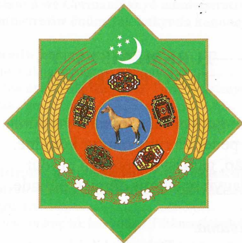
TÜRKMENISTANYŇ DÖWLET TUGRASY